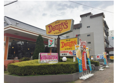
デニーズ松原店 まで70m