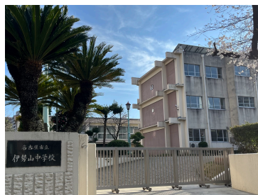
名古屋市立伊勢山中学校 まで513m