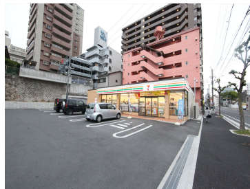
セブンイレブン名古屋正木2丁目店 まで504m