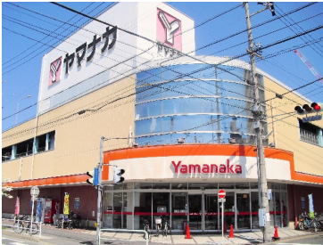
ヤマナカ松原店 まで352m