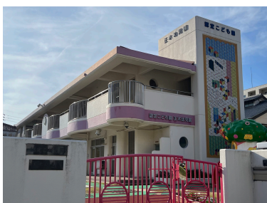
認定こども園正木幼稚園 まで579m