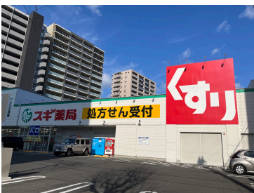
スギ薬局正木店 まで193m