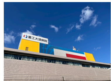
医療法人桂名会重工大須病院 まで593m