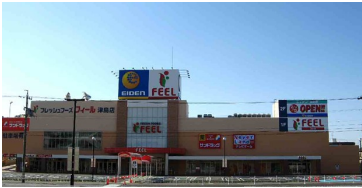
フィール津島店 まで252m