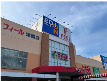
エディオン津島店 まで238m