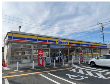
ミニストップ津島昭和ミニストップ津島昭和町店町店 まで120m