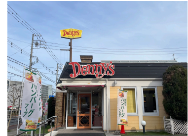
デニーズ津島店 まで571m