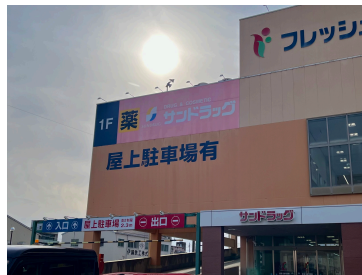
サンドラッグ津島店 まで238m